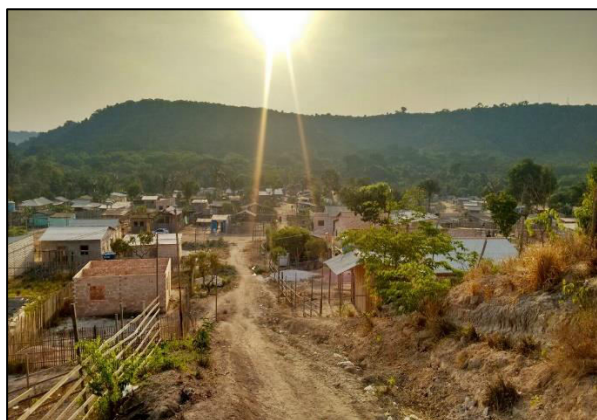
Figura 02 - Ocupação Alto Vigia.