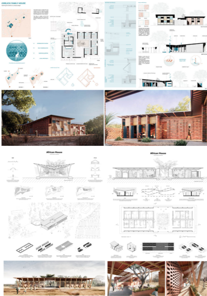
Figura 5. Espaços de moradia da Família Jorejick

O diferencial entre as duas propostas aparenta ser a estratégia de apresentação, evidenciado pela diferente maneira utilizada pelos participantes para se apropriar das regras de representação do desenho arquitetônico. Nesse quesito, o primeiro lugar se destaca, com a elaboração de plantas coloridas para a explicação de áreas internas e externas. A substituição do corte pelo detalhamento com escala mais ampliada demonstra uma estratégia gráfica de se aproximar do sistema construtivo. A representação das fachadas coloridas, mescladas com perspectivas isométricas explicativas dos sistemas prediais permite a leitura simultânea de decisões técnicas e sua interferência na aparência do prédio. O segundo lugar, apesar da preocupação com a análise técnica de elementos do clima e dos componentes construtivos, apresenta uma estratégia com menos elementos de destaque para a leitura dessas decisões.