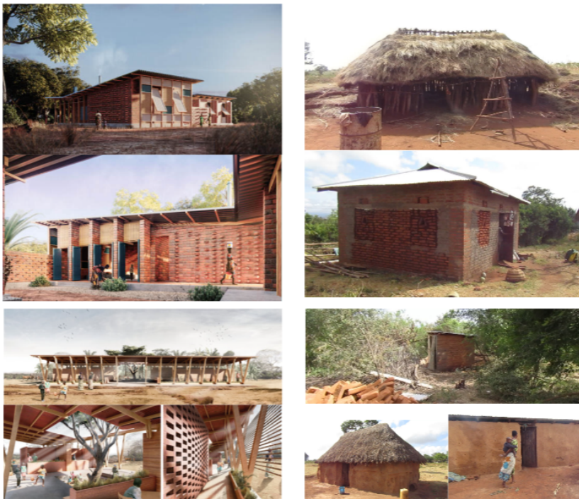
Figura 6. Composição Simulação e Realidade (fonte: ARCHSTORMING, 2020)

Apesar de representarem uma boa forma de antecipação da futura realidade, acredito que a função das perspectivas arquitetônicas, dentro da lógica de competição do concurso, seja a de atrair o olhar e permitir a contemplação de quem avalia. Ao inserir o seu leitor dentro da realidade simulada, elas se tornam componentes da espetacularização e do convencimento sobre a capacidade de domínio técnico e estético de quem a elaborou. A noção de performance também auxilia o conflito imagético próprio do enquadramento provindo do diagnóstico. Expresso e estruturado agora nas propostas, como demonstrado na composição expressa na Figura 5, as imagens fruto da simulação digital reforçam a falsa superioridade das propostas arquitetônicas sobre o espaço elaborado pela capacidade dos moradores.