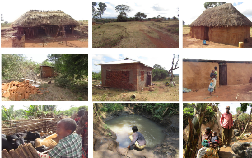
Figura 4. Espaços de moradia da Família Jorejick

Ao lançar o olhar sob o lugar, a contribuição para as condições de reconhecimento se veem expressas no conjunto de fotos presentes na Figura 4. A imagem da precariedade do complexo é desenvolvida ao se apresentar as cabanas e construções como elementos sem qualidade construtiva. O documento destaca a ausência de acesso à água tratada e ao esgoto, com a existência de coleta de água dos lagos próximos ao local e a existência de uma rede de latrinas para o direcionamento de rejeitos. Por outro lado, não há revelações sobre os vínculos pessoais com o espaço. Não se evidencia qualquer tipo de significação para as pessoas que lá residem, apesar das fotografias mostrarem a ocorrência de relações e eventos familiares. Em todo o tempo de residência dos Jorejick no lugar, é possível inferir que celebrações e conquistas, assim como perdas e frustrações, foram compartilhadas naqueles espaços. Onde estaria o significado daquilo que transforma essas construções em uma moradia?