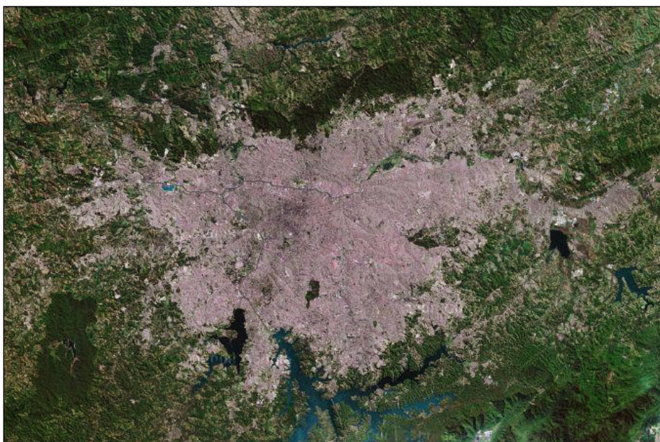
Figura 2: Imagem de satélite da RMSP (2002)

tanto pelo porte dos problemas quanto pela escala em que as questões ocorrem, geralmente envolvendo diversos municípios e de forma multissetorial. A formulação de políticas para uma configuração espacial tão específica quanto as grandes manchas urbanas resulta também na demanda de uma forma especial de organização pública.