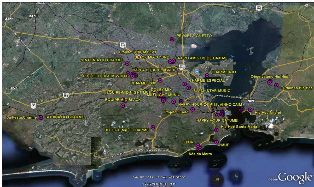
Figura 4: Mapa dos eventos de hip hop no Rio de Janeiro, Niterói e São Gonçalo segundo os produtores de eventos.