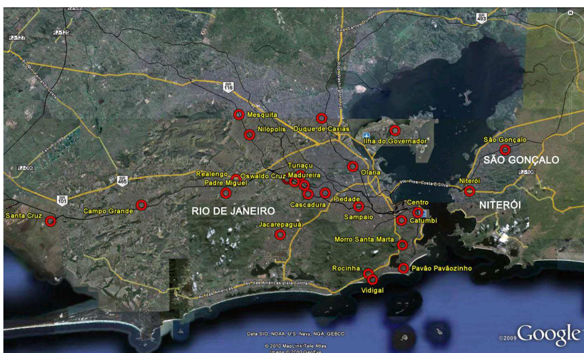
Figura 3: Mapa dos Bairros no Rio de Janeiro, Niterói e São Gonçalo onde ocorrem festas e eventos ligados ao movimento hip hop .

O processo de visibilidade do movimento hip hop através das redes virtuais é espacializado no espaço físico, o que observamos é a pulverização do hip hop em diversos bairros e municípios da região metropolitana da cidade do Rio de Janeiro e municípios vizinhos como Niterói e São Gonçalo (figura 3).