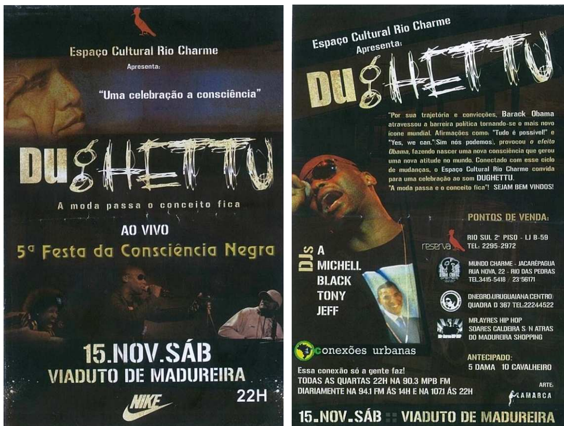
Figura 01: Flyer de divulgação da 5ª Festa da Consciência Negra realizada sob o Viaduto de Madureira em 2008 que confirma o caráter reivindicatório e de afirmação da cultura negra do Movimento hip hop, e que neste momento tomou como slogan a frase dita por Barack Obama “Sim nós podemos”.