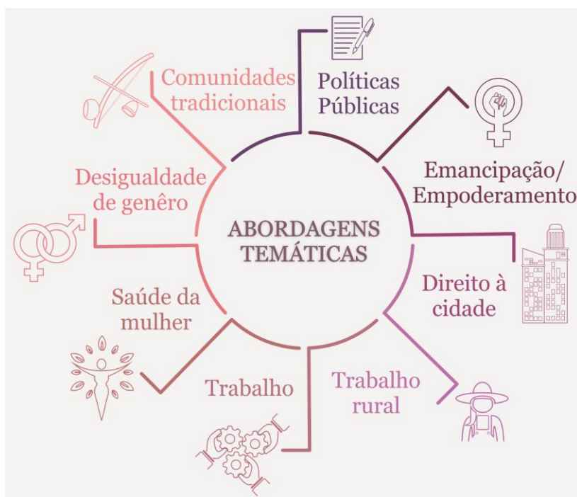
Infográfico 1 - Abordagens temáticas sobre a mulheres nas pesquisas desenvolvidas nos PPGPUR