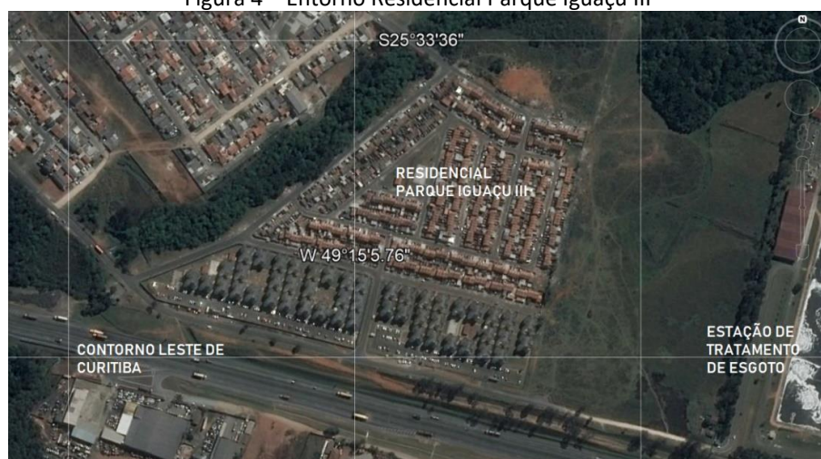
Figura 4 – Entorno Residencial Parque Iguazu III

Fonte: adaptado de GOOGLE EARTH PRO, 2018.