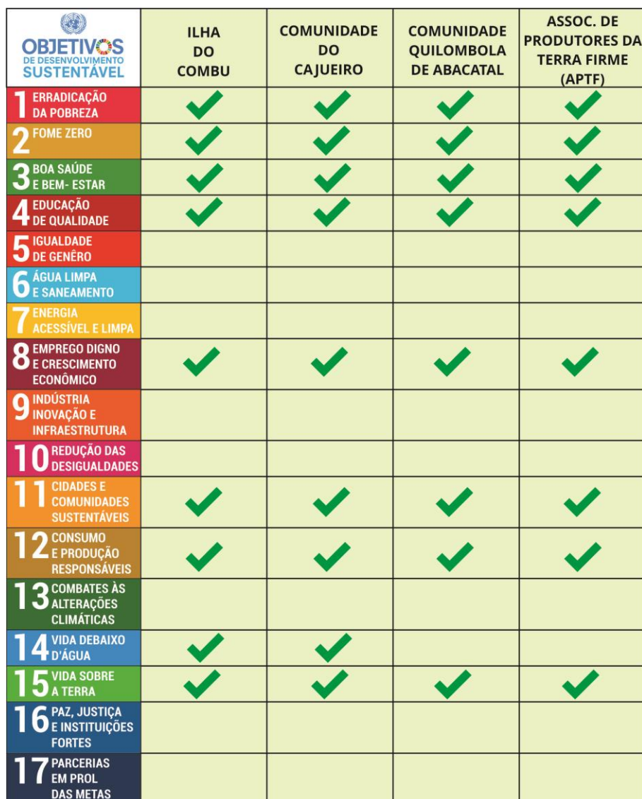
Quadro 2: Verificação do atendimento dos objetivos da Agenda 2030 pelas comunidades estudadas .

Todas as comunidades asseguram condições de reprodução da vida, através de práticas ligadas ao ambiente natural. Na ilha do Combu, uma das 39 ilhas de Belém, o extrativismo de coleta do açaí é atividade econômica predominante, para subsistência e venda de eventual excedente, garantindo boa alimentação e qualidade de vida. Na comunidade do cajueiro a pesca artesanal garante renda e boas condições de alimentação à população local. A Comunidade Quilombola de Abacatal possui diversas atividades econômicas como a fruticultura, piscicultura, artesanato, extrativismo, produção de carvão e de derivados da mandioca (farinha d'água, farinha de tapioca, goma e tucupi) para consumo das famílias e venda do excedente na feira do produtor, organizada pelos próprios comunitários na feira de Ananindeua. A APTF vende hortaliças diretamente na CEASA-Pa.