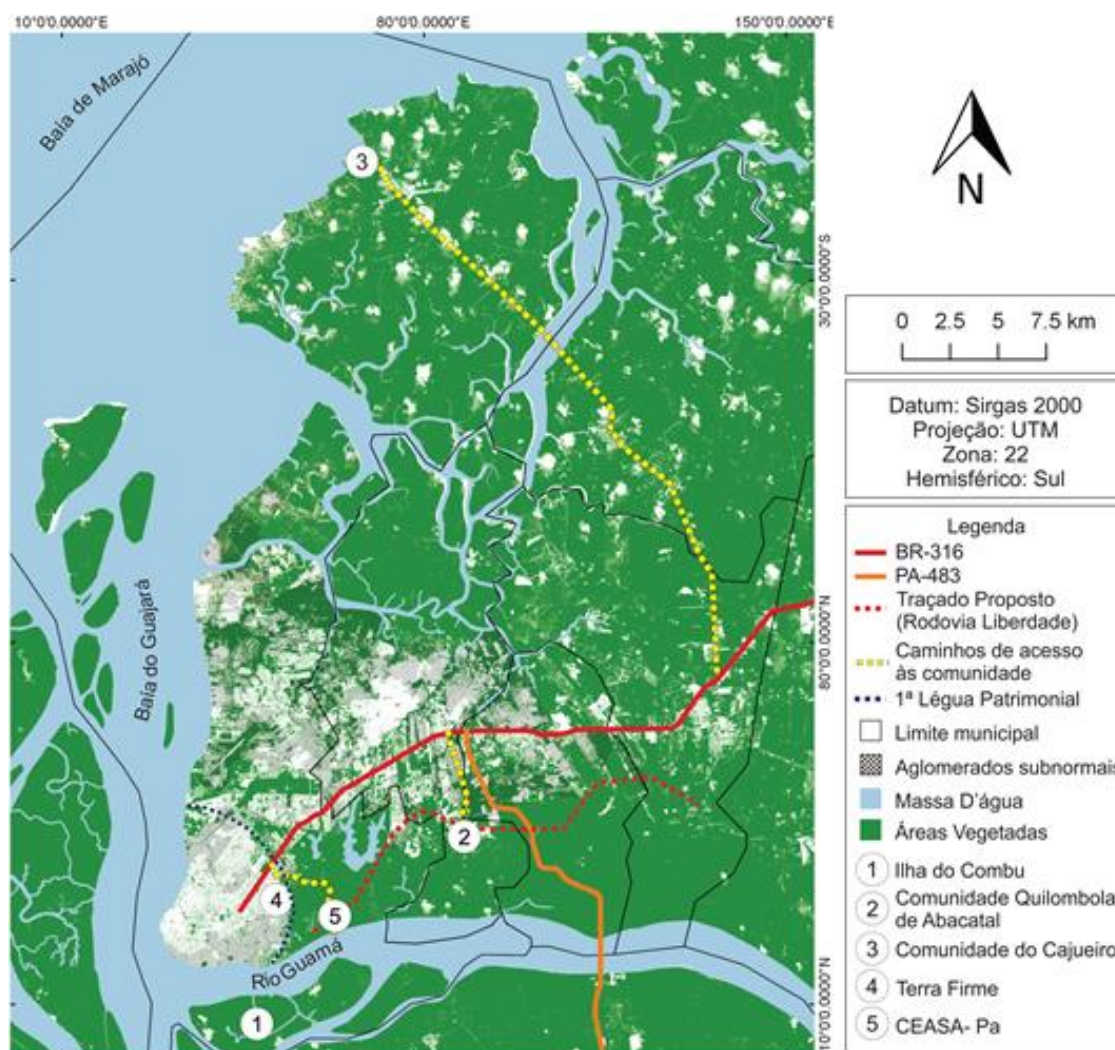
Figura 1: Mancha urbana conurbada, áreas vegetadas e aglomerados subnormais na RMB. Fonte: MRE (1936); IBGE (2010b); DNIT (2013); IDESP (2012); GeoCatálogo do MMA (2015). Elaborado pelas autoras.

em período de cheia; e remanejada para as terras da CEASA, com concessão de terra para plantio, sem local para moradia.