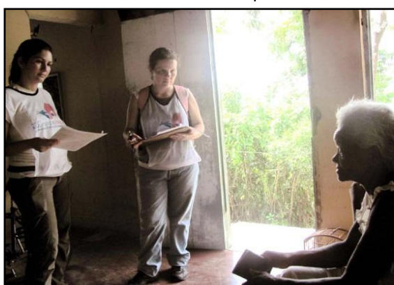
Figura 03: Visita Domiciliar de assistente social e arquiteta

situações de riscos à saúde e segurança pessoal, e sobre a qualidade do ambiente interno das unidades habitacionais. Sua aplicação é realizada a partir da interação entre os habitantes e técnicos, onde há um esclarecimento do profissional ao morador sobre as manifestações patológicas, e por sua vez, uma leitura do técnico com base na vivência da pessoa que reside no ambiente avaliado. Dessa maneira, o Mapa de Riscos pode ser entendido como um instrumento de Tecnologia Social. Indica por meio de croquis a localização das anomalias e é aplicado em parceria com o morador.” (SOLUÇÕES URBANAS, 2010)