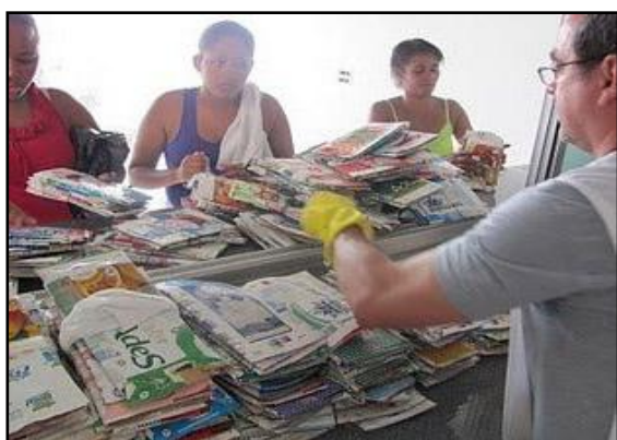
Figura 05: Troca das embalagens pela moeda comunitária

Assim, a Feira de Trocas Solidárias foi criada para que os beneficiários do projeto pudessem acessar, com uso de moeda comunitária, materiais de construção necessários à execução das obras propostas. Estes materiais de construção eram provenientes de doações institucionais (demarca de lojas) e de pessoas físicas (excedente de obras particulares). Por sua vez, os beneficiários os adquiriam pagando com a moeda comunitária chamada Trocado Vital (Tr$), obtida na troca por embalagens longa vida pós-consumo, na razão de 4 x 1. Assim, por exemplo, caso o morador adquirisse 1m 2 de revestimento cerâmico ao custo de Tr$ 5,00, representaria a retirada de 20 embalagens do meio ambiente. Posteriormente, estas embalagens eram transformadas em telhas ecológicas por uma empresa parceira, que as devolviam à Feira para que pudessem ser vendidas aos beneficiários, com preço em Tr$. Por fim, sobre a periodicidade da Feira, esta variava de acordo com a quantidade de doações de material de construção, podendo ser mensal ou bimensal.