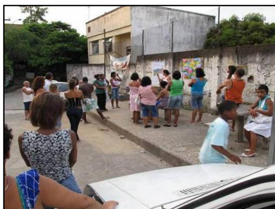
Figura 01: Processo participativo para formulação dos critérios comunitários

Predominantemente, os critérios comunitários consonavam com os critérios técnicos, por exemplo, quando a comunidade votou pela priorização dos moradores “ idosos sem cuidadores ” e “ mães solteiras ”. Porém, também houve casos de contraposição. Um exemplo interessante desta contraposição ocorreu durante a apresentação da condicionante adensamento excessivo pela equipe do projeto. Uma das moradoras defendeu a seguinte ideia: “ muita gente na mesma casa, tem mais chances de conseguir dinheiro para pagar um profissional, ué?! Não tá certo ajudar a eles primeiro! ”. Outra corroborou “ se tem um monte de gente e a casa ‘tá caindo aos pedaços, é por que são encostados [preguiçosos]. O projeto tem que ajudar o povo trabalhador! E não gente encostada! ”.