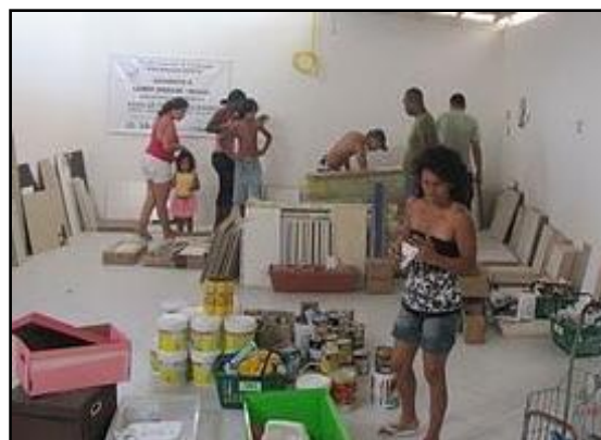
Figura 06: Feira de Trocas Solidárias no Centro Comunitário do morro Vital Brazil