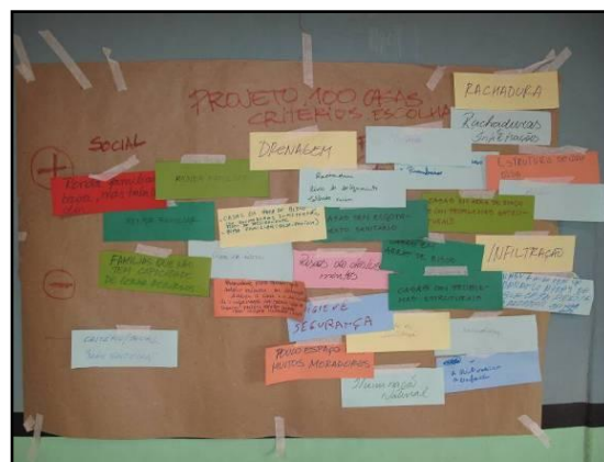
Figura 02: Mural resultante do processo participativo