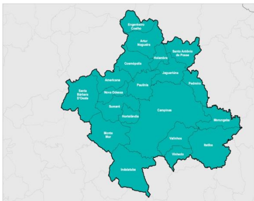
Figura 1- Região Metropolitana de Campinas.

milhões de habitantes, de acordo com estimativa do Instituto Brasileiro de Geografia e Estatística (IBGE) para 2017, e gerou 8,5% do Produto Interno Bruto (PIB) estadual em 2014. (EMPLASA, 2017)