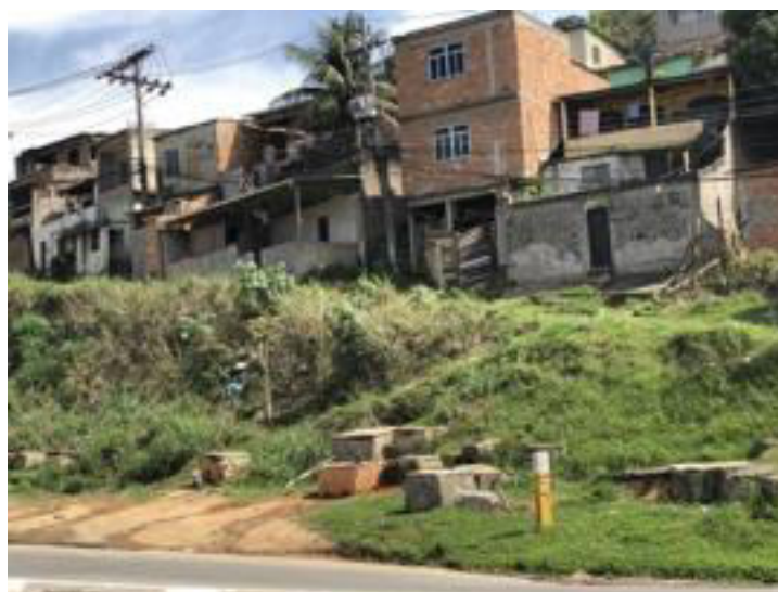
Figura 1: Captações em SAIs a margem da Rodovia Presidente Dutra, trecho Baixada Fluminense.

Todavia, esta importante interface do abastecimento da população em regra não é considerada pelos sistemas de regulação e de governança convencionais. Caracterizados pelo IBGE (2010) como "poços rasos e/ou minas d'água utilizadas para uso domiciliar", no item "Características da População e dos Domicílios". Somente no Estado do Rio de Janeiro existiriam mais de quinhentos mil domicílios que captam água através de sistemas alternativos como poços caseiros (poços do tipo cacimba, poços ponteira, poços caipiras e outras modalidades) e ainda fontes e minas d'água no próprio terreno, R9 – Metas e Estratégias de implementação dos Cenários Propostos Plano Estadual de Recursos Hídricos – PERHI (2013,p83). A figura 1 apresenta várias captações em uma comunidade a margem da rodovia Presidente Dutra no trecho da Baixada Fluminense. Observar a proximidade de um marco de um duto da Petrobrás.