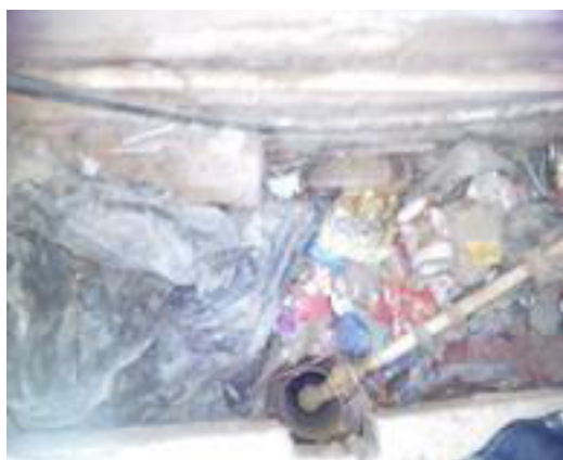
Figura 4: Poço em SAls perfurado em local totalmente inapropriado.

alternativos em locais totalmente inadequados, contíguos a banheiros, depósitos de lixo e cemitério, conforme demonstram a figura 4