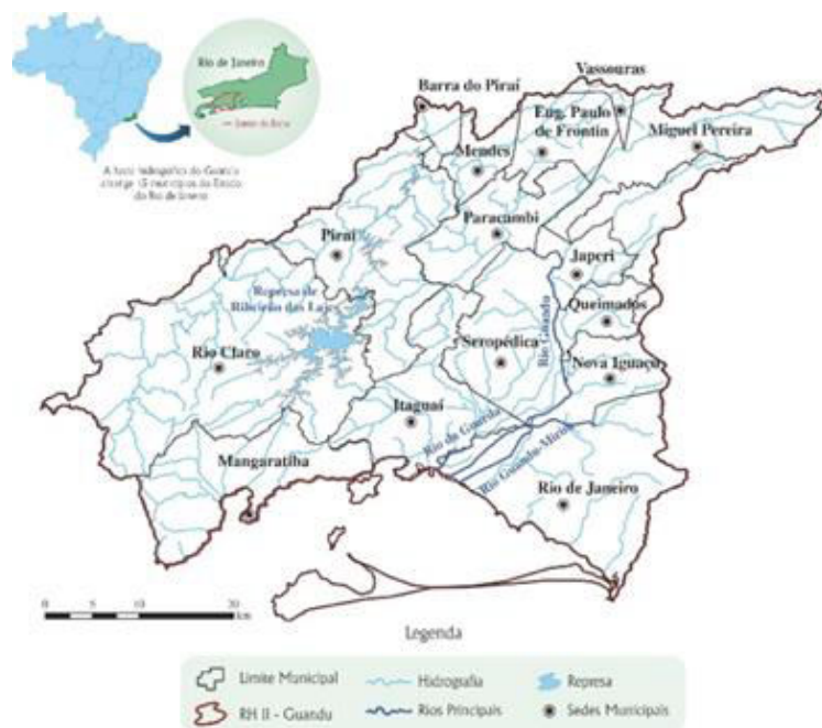
Figura 2: Mapa da Região Hidrográfica II, área de competência do Comitê Guandu

O Comitê das Bacias Hidrográficas dos rios Guandu, da Guarda e Guandu Mirim – Comitê Guandu, foi criado pelo Decreto Estadual nº 31.178, de 3 de abril de 2002, do Governo do Estado do Rio de Janeiro e teve sua área de atuação ampliada pelo Decreto Estadual nº 18, de 08 de novembro de 2006. Caracterizado como o parlamento das águas, é corresponsável pela gestão das águas brutas, que tratadas atendem a mais de dez milhões de habitantes, de parte da região metropolitana do Rio de Janeiro. Sem dúvida é um dos comitês de bacia hidrográfica brasileiros que mais avançaram na gestão dos recursos hídricos e no desenvolvimento dos instrumentos de gestão previstos na Lei Federal nº 9433/1997 e, na correspondente no Estado do Rio de Janeiro, Lei Fluminense nº 3.239/1999, sendo citado em diversos trabalhos acadêmicos e por organismos internacionais como exemplo de uma experiência exitosa na gestão dos recursos hídricos no Brasil. A figura 2 apresenta o mapa da Região Hidrográfica II do estado do Rio de Janeiro área de competência do Comitê Guandu