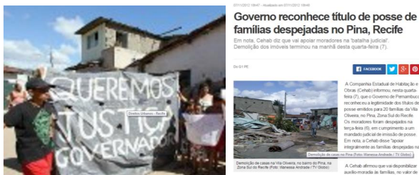
Fig. 5. Manifestação dos moradores da Comunidade Vila Oliveira

O caso é bastante emblemático, pois se há uma disputa quanto à propriedade da terra, seria entre os supostos proprietários e o governo estadual. Pois, os moradores encontravam-se com seus títulos de posse em mãos, entregues pelo próprio estado. No entanto, toda a vila foi demolida e os moradores foram transferidos para uma área distante enquanto aguardam outro processo judicial ser julgado, os quais os moradores é que pedem a reintegração de posse do terreno, uma vez que, o estado comprova que o terreno havia sido desapropriado e foi titulado em prol dos moradores. Há indícios de que o interesse pelos supostos proprietários ocorreu devido à construção do shopping e a valorização da área, e assim, houve uma tentativa de anular a ação de desapropriação promovida pelo governo estadual. As Figuras 5 e 6 mostram o protesto dos moradores e matéria de jornal sobre o caso.