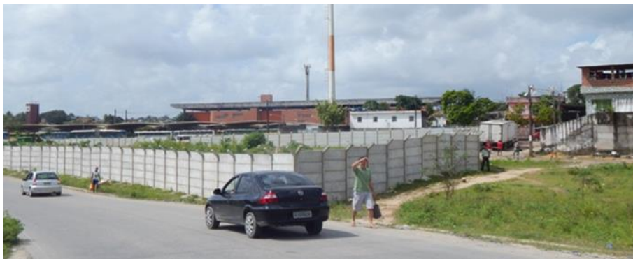
Fig. 4 Antiga área do Loteamento São Francisco, onde existiam moradias, hoje existe uma cerca colocada por uma empresa privada.

O que tem em comum nesses dois casos? No caso da ZEIS Coque, o zoneamento especial não foi respeitado pelo próprio poder executivo que deveria garantir a manutenção das famílias. No caso da ZEIS e do Loteamento São Francisco observa-se também a participação do poder público na prevalência da prerrogativa da desapropriação justificada pela utilidade pública em função das obras da Copa, em detrimento da população residente consolidada, fato este bem expresso nas palavras da moradora da comunidade do Coque: