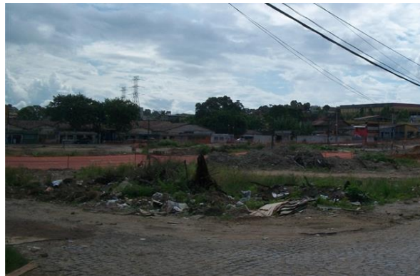
Fig. 3. Antiga área do Loteamento São Francisco todo demolido.

Portanto, um dos aspectos mais emblemáticos desse caso é que passada a Copa de 2014, as obras nessa área, nem sequer, foram iniciadas. A área objeto de desapropriação encontra-se vazia e sem nenhuma utilidade pública. Ao contrário, posteriormente, a área originada com as desapropriações foi cercada por uma empresa particular, conforme relato dos moradores do entorno. A Figura 4 mostra o estado atual do local onde viviam centenas de famílias.