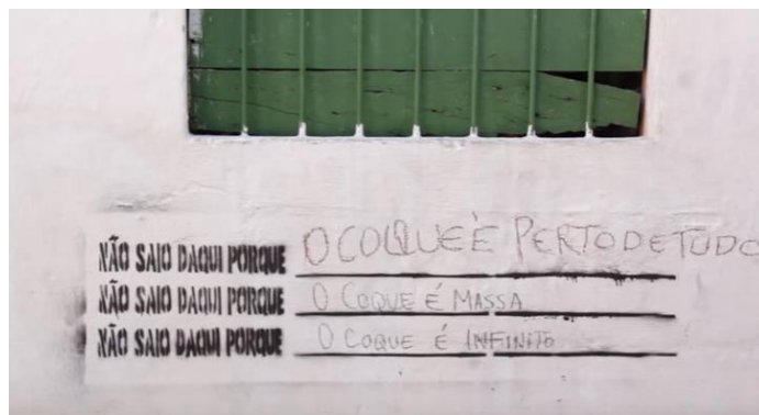
Fig. 1. Processo de resistência dos moradores para Permanecerem na comunidade. Fonte: Movimento Coque R(E)xiste, 2016.