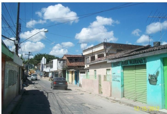
Fig. 2. Loteamento São Francisco

Realizaram-se denúncias ao Comitê Popular da Copa, protestos públicos, e também foi um dos locais visitado pela relatoria da ONU. Porém, todos os moradores foram retirados de suas casas através de ordem judicial e as casas foram demolidas, antes mesmo de terem acesso à indenização pelo imóvel, devido à urgência que se dizia ter na realização da obra. Muitos moradores foram morar em casa de parentes, já que o preço da indenização oferecida não permitiu a compra de outro imóvel. Em decorrência desses fatos, houve registros de doenças e até casos de morte, atingindo principalmente a população de idosos, população mais vulnerável quando se trata de despejos forçados. A Figura 2 apresenta o bairro ainda com as moradias e a Figura 3, já com as casas demolidas.