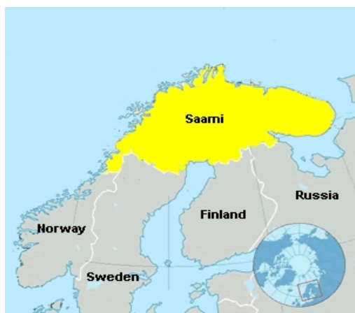
Mapa 1: Localização dos Sami

Minoria étnica distribuída entre o norte da Noruega 4 , Finlândia, Suécia e Rússia o reconhecimento deste grupo coletivamente e a afirmação de sua identidade foi um processo que se iniciou ainda no início do século XX, quando em 1906 o primeiro representante Sami foi eleito para o Parlamento Norueguês. As mobilizações neste período contra as políticas assimilacionistas implementadas pelo sistema escolar que previam a substituição linguística e cultural, a introdução de práticas higienistas como novos hábitos cotidianos, novos critérios de realização das atividades de pesca e criação de renas (base econômica Sami) além do controle da compra de terras públicas levaram as primeiras organizações voltadas a essas questões.