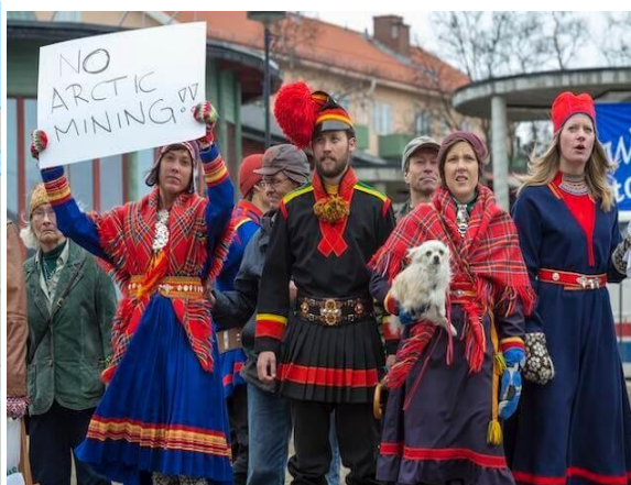
Figura 1: Protesto Sami em 2014