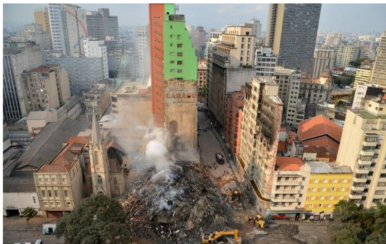
Figura 1: Lugar onde era o Edifício Wilton Paes de Almeida