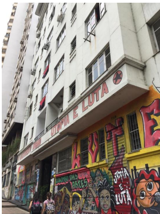
Figura 2: Ocupação Utopia e Luta, no centro de Porto Alegre