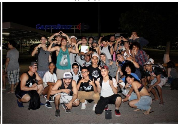
Figura 10 – Batalha da C4 no estacionamento do Carrefour.