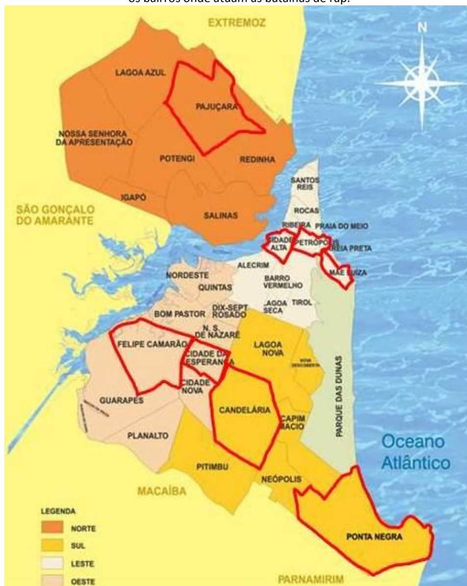
Figura 1 – Localização dos bairros de Natal/RN e de suas Regiões Administrativas – destaque em vermelho para os bairros onde atuam as batalhas de rap.

Fonte: www.sedis.ufrn.br . Nota: Reelaborado pelos autores.