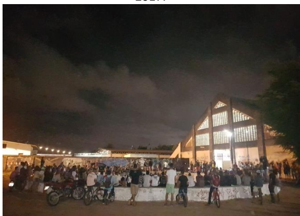
Figura 4 – Batalha de mc’s no dia 13 de julho de 2017.