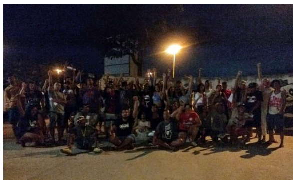
Figura 3 – Público presente na BDV.