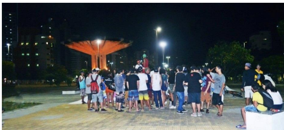
Figura 8 – Público prestigiando a Batalha do Disco na Praça do Disco.

Outra batalha que vem conseguindo se manter firme nas atividades, apesar de todos os percalços inerentes a este tipo de movimento, é a “Batalha do Disco”. Realizada todas as quartas-feiras na Praça do Disco, localizada no conjunto de Ponta Negra no bairro homônimo 15 suas atividades estão centradas nos duelos de MC's , pois o grupo ainda não possui uma estrutura que possibilite o desenvolvimento de atividades de grande dimensão. Assim como nas duas batalhas anteriores, os duelos são realizados apenas com a caixa de som (Figura 8), não existe uma estrutura maior, como se vê na BDV. No entanto, o grupo possui um núcleo que tem procurado se estruturar e aperfeiçoar suas atividades com o auxílio de outras batalhas. Dessa forma, pode-se inferir que os caminhos percorridos apontam para uma possível consolidação e ampliação da Batalha do Disco no contexto da cidade de Natal.