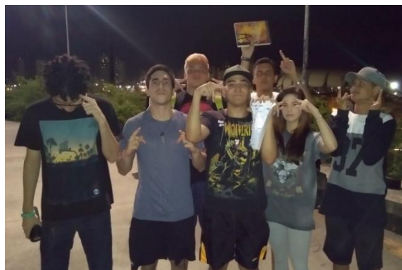
Figura 7 – Foto do vencedor da noite.