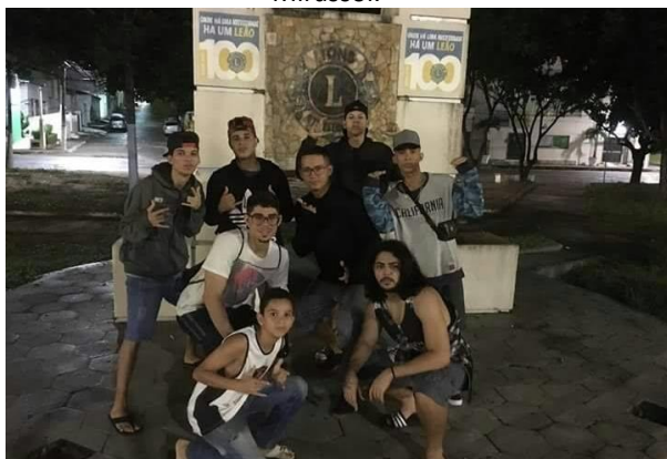
Figura 9 – Primeira Batalha da C4 na Praça de Mirassol.

A Batalha criada mais recentemente ocorre no estacionamento do supermercado Carrefour 16 e é conhecida como “Batalha do C4”. Apesar de ainda prematura, já conta com meios de divulgação amplos ( Facebook, Instagram e Canal no Youtube ), por meio dos quais são feitas todas as convocações e mudanças de plano, caso haja algum imprevisto. Por se tratar de um espaço privado, a Batalha do C4 vem passando por alguns problemas. Recentemente, foram estabelecidas algumas regras pela diretoria do Carrefour, como por exemplo, a proibição do uso de som (até mesmo de celulares), para que as batalhas pudessem continuar sendo realizadas no estacionamento do referido supermercado (Figura 10). Essas proibições dificultariam os duelos, tendo em vista que o som é um material imprescindível nas batalhas de MC’s , haja vista a necessidade de uma trilha sonora. Por isso, a organização da “C4” decidiu migrar para a Praça do Conjunto Habitacional, existente em sua proximidade, Mirassol (Figura 9), um espaço público, pois dessa forma não haveria restrições.