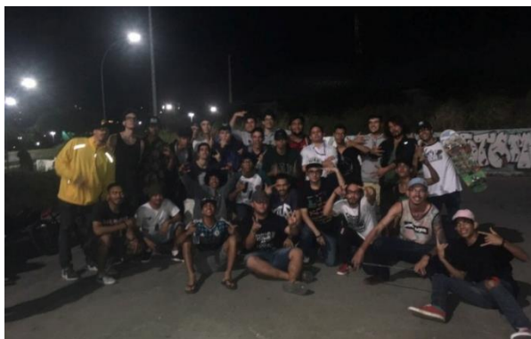
Figura 6 – Público na Batalha do DED.

reunir a qualquer custo, sendo o espaço público o local de suporte para as atividades. Ou seja, a ausência de infraestrutura não determina necessariamente o desenvolvimento dos eventos.