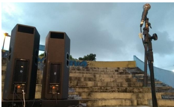
Figura 2 – Equipamentos da BDV.

A “Batalha do Vinho” se estruturou tomando como referência o duelo de MC’s Nacional, mas também teve forte influência da “Batalha da Vermelha”. Apesar de esta ter sido a primeira batalha criada no estado, foi a BDV 6 a grande incentivadora: todas que foram criadas em Natal, teve grande influência da Batalha do Vinho 7 . Ainda de acordo com Roney 8 diversas são as atividades desenvolvidas pelo movimento, que vão desde as batalhas de MC’s (Figura 2 e Figura 3), que ocorrem todos os sábados no Centro Cultural Jesiel Figueiredo (Zona Norte de Natal), até os trabalhos sociais, com arrecadação de alimentos e distribuição para as famílias necessitadas. São feitas também rodas de conversas sobre os mais variados temas, acompanhamento dos MC’s mais novos com preparação por meio de estudos e contribuição com o fortalecimento de outros coletivos, dentre outras atividades.