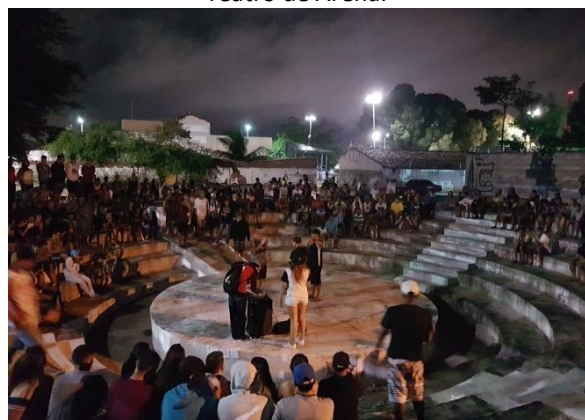
Figura 5 – Batalha de mc’s – destaque para o uso do Teatro de Arena.