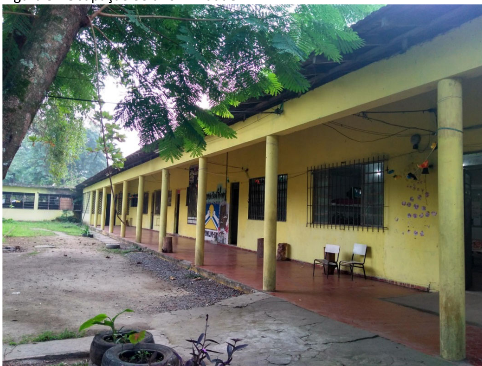
Figura 3 - Ocupação Solano Trindade