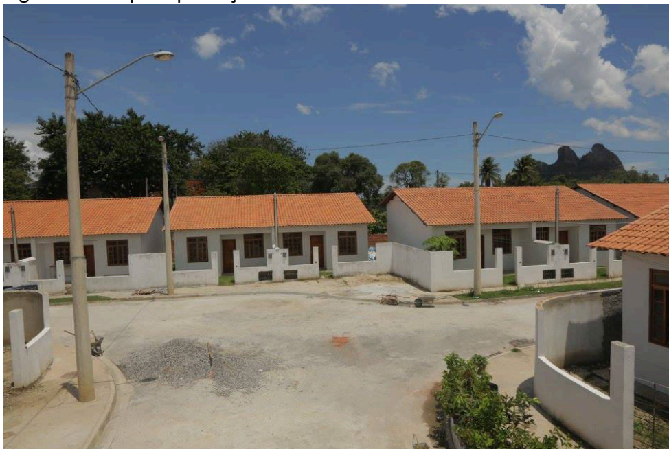
Figura 2 – Grupo Esperança em obras