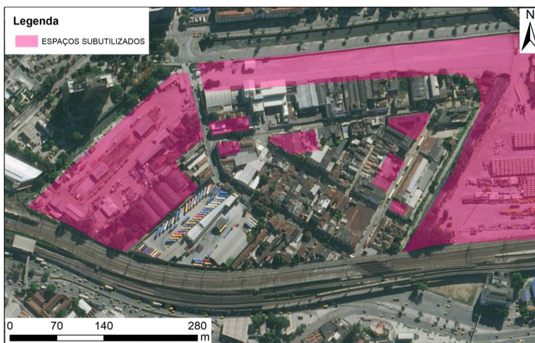
Figura 5 – Mapa de Espaços Subutilizados.

Há alguns espaços subutilizados e deteriorados, alguns com a potencialidade de serem reaproveitados. O maior deles é o terreno da antiga linha de trem da Leopoldina, que não está abandonada, mas sim sem uso. Os demais terrenos são usados como estacionamentos, já os edifícios, alguns estão ocupados como forma de moradia e outros estão totalmente inutilizados, restando apenas as fachadas para o uso de intervenções artísticas como o grafite (Figura 5).