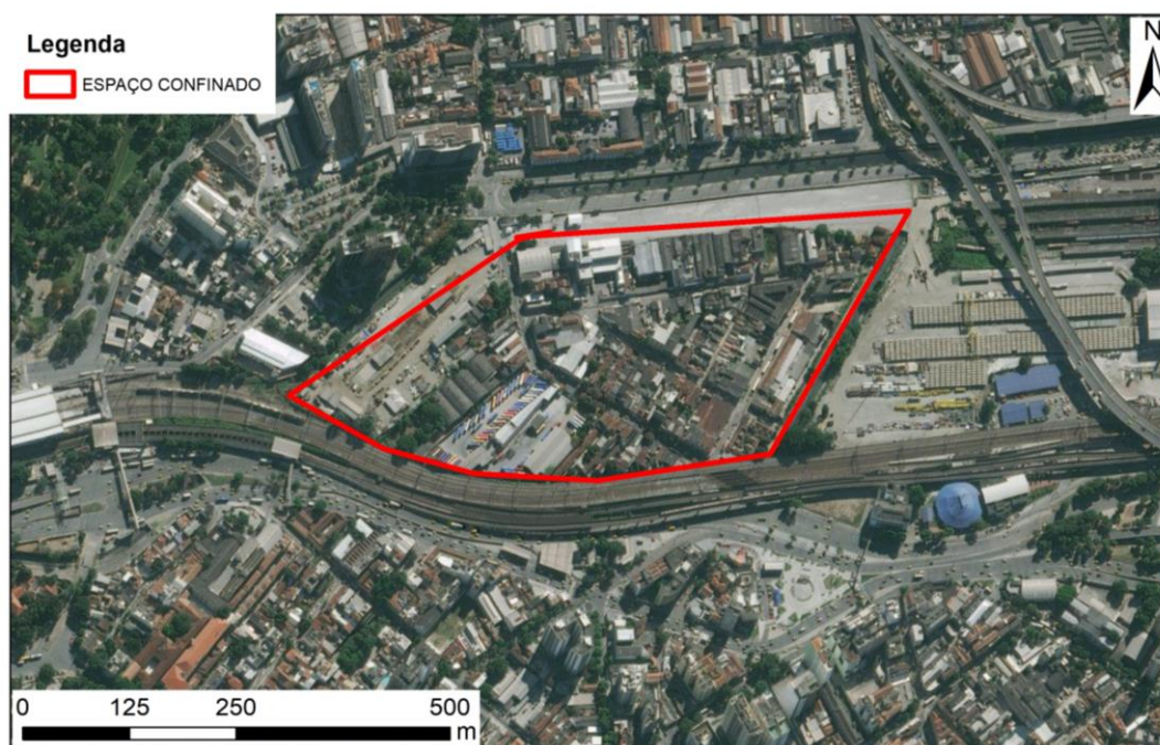
Figura 2 – Mapa do Espaço Confinado.

A rua Ceará é uma rua “principal” com grande fluxo de veículos que foi aberta em 2014, gerando assim mais permeabilidade neste tecido urbano, que conta com mais três ruas locais, dentre elas a Sotero dos Reis (rua da zona de prostituição). Tal configuração urbana mesmo segregando seus agentes, é favorável em termos de segurança e preservação das prostitutas que dizem se sentirem resguardadas em relação às pessoas de “fora”, ou seja, protegidas da cidade.