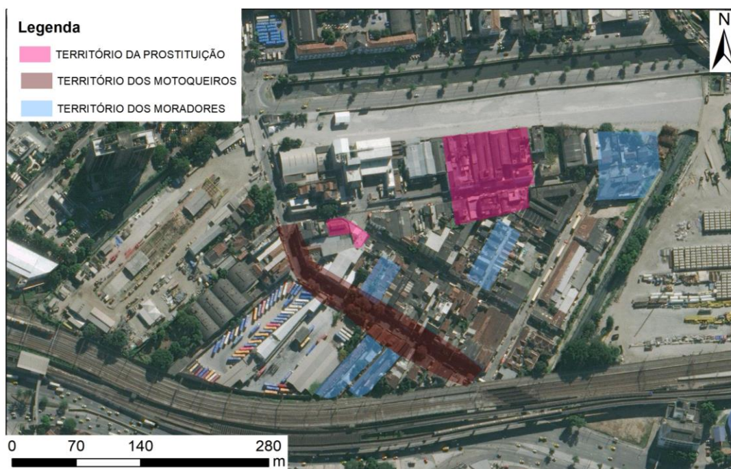
Figura 4 – Mapa de Territórios.

Há alguns espaços subutilizados e deteriorados, alguns com a potencialidade de serem reaproveitados. O maior deles é o terreno da antiga linha de trem da Leopoldina, que não está abandonada, mas sim sem uso. Os demais terrenos são usados como estacionamentos, já os edifícios, alguns estão ocupados como forma de moradia e outros estão totalmente inutilizados, restando apenas as fachadas para o uso de intervenções artísticas como o grafite (Figura 5).