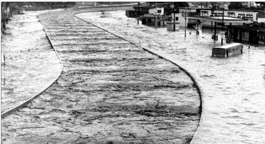
Figura 2: Enchente do Ribeirão Arrudas durante um pico hidráulico.

Data: ano de 1987.