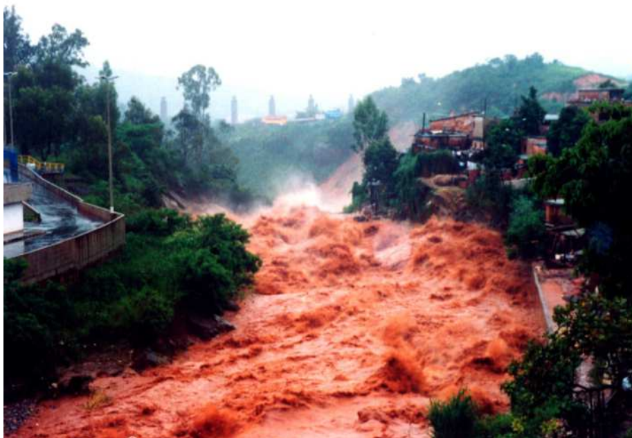
Figura 4: Fluxo do Ribeirão Arrudas durante um pico hidráulico no limite de Belo Horizonte e Sabará.